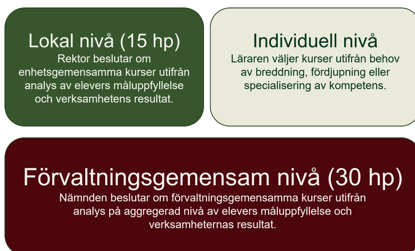
Figur 2. Nämndens upplägg för ökad likvärdighet

Nämnden uppfattar att professionsprogrammet skapar möjlighet att stärka likvärdigheten i förvaltningens verksamheter. Utgångspunkten är att oavsett i vilken av nämndens verksamheter som eleven studerar, ska kompetensen inom ett antal valda områdena vara hög. Nämnden fattar beslut om att åtta kurser (om 7,5 hp 12 vardera) ska vara förvaltningsgemensamma. Kurserna ska väljas utifrån en analys på aggregerad nivå av elevers måluppfyllelse och verksamheternas resultat. Lärare i samråd med rektor väljer fyra av de åtta förvaltningsgemensamma kurserna, motsvarande 30 hp (figur 2). Urvalet av de förvaltningsgemensamma kurserna kommer att utvärderas årligen och revideras utifrån behov på aggregerad nivå.